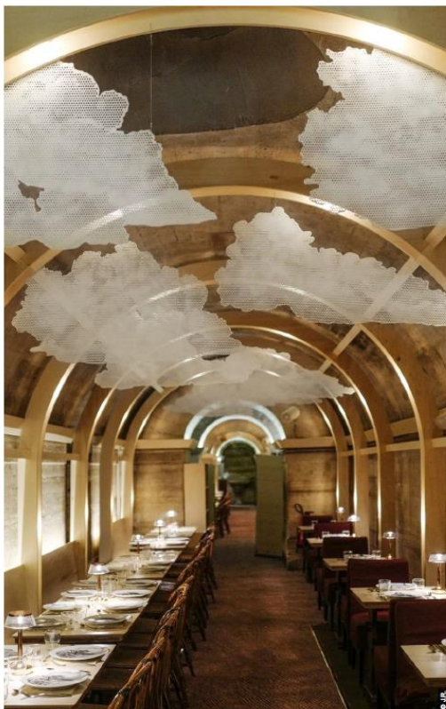
← Refettorio, Paris

In het kader van de aankomende september editie van de Maison&Objet kiest Ramy Fischler ervoor om de dagelijkse diversiteit van zijn studio en zijn projecten te presenteren zodat het publiek zijn visionaire en holistische benadering kan ontdekken. Veel meer dan alleen een verzameling voorwerpen en projecten!